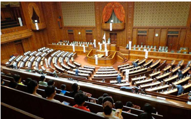
国会議事堂の本会議場です。

先週の21日(水)の校外学習は、お天気の心配や国会が行われていることへの心配等、前日までどうなるかとドキドキしっぱなしでした。しかし、6年生が心を込めて作ったたくさんののてるてる坊主や、47名の子供たちの日頃の頑張りなどのおかげで、当日はよい天気に恵まれ、しっかりと学習することができました。保護者の皆様には、朝早くからのお弁当作りや送り迎えなどにご協力をいただきありがとうございました。