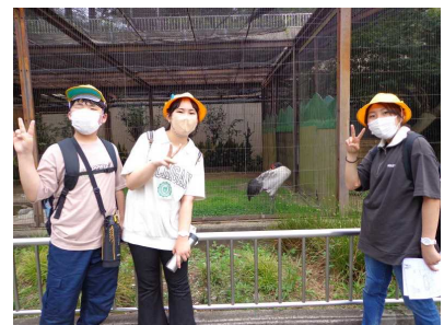
国語の「風切る翼」に出てきた鶴がいました。