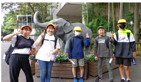
本物の象もいたんだけど・・・